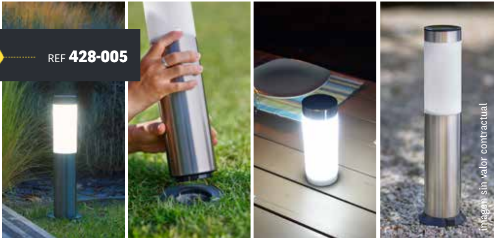
Imagen sin valor contractual

Los bornes solares Gard&Rock se fabrican de acero inoxidable barnizado para garantizar una estética y prolongada vida útil. Con una altura por encima del suelo de 41 cm y un diámetro de 8 cm, usted podrá aprovechar un diseño moderno y elegante que se integra perfectamente al jardín y en armonía con la naturaleza. Encastrados opcionalmente a las bases de anclaje Gard&Rock, usted podrá asegurarse de una instalación sólida y desmontable de vuestra iluminación.