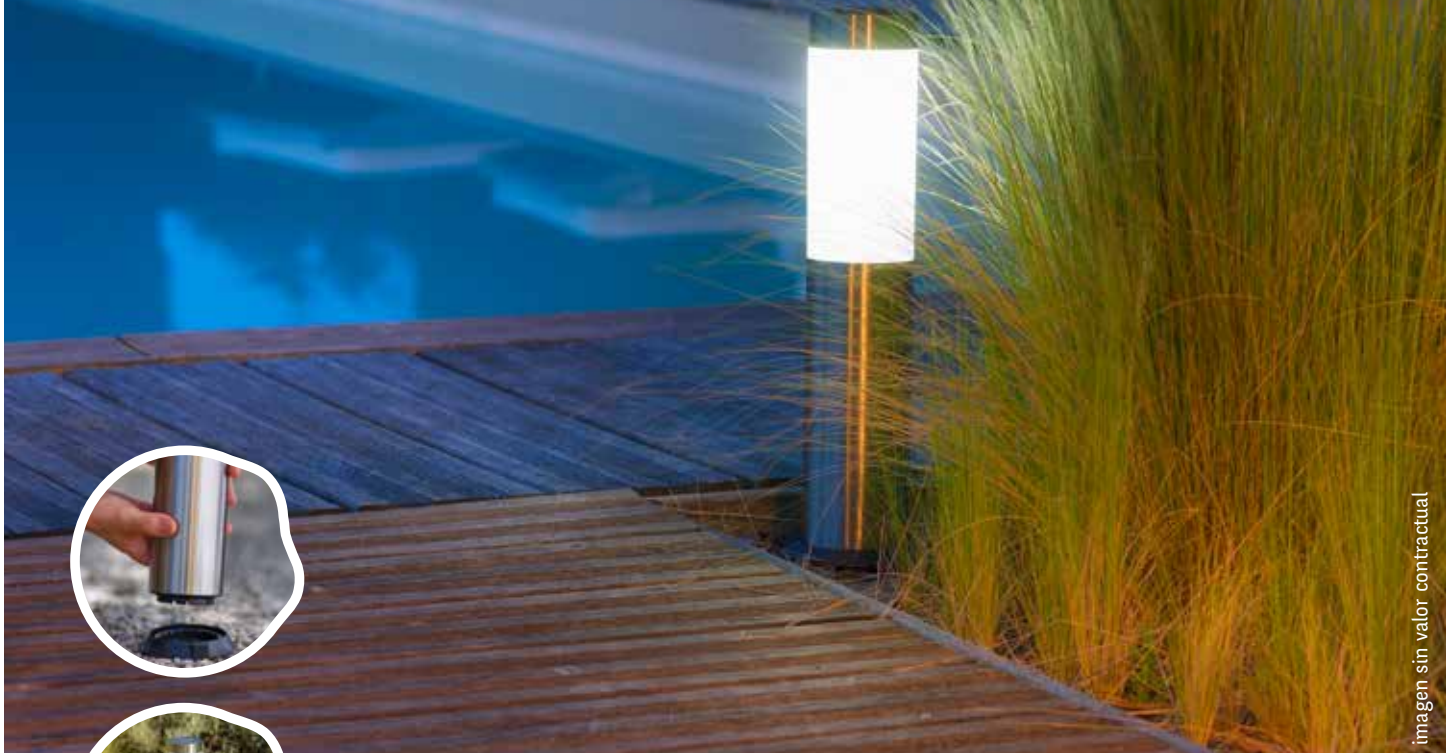
imagen sin valor contractual

PARA ENCASTRAR EN LAS BASES O AL ZÓCALO FIJO EN EL PISO